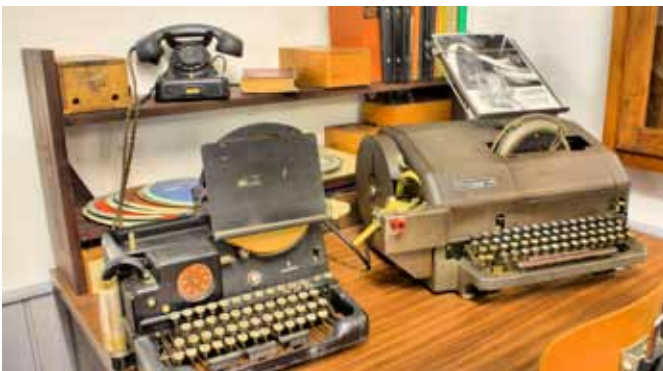
Lochstreifenstanzer und -leser waren lange Zeit die modernste Möglichkeit, Linotype-Maschinen automatisiert Lettern produzieren zu lassen.

Doch mit dem Druck ist das Buch noch lange nicht fertig. Die einzelnen Blätter müssen auch noch zu einem Buch gebunden werden. Auch dazu gibt es im Museum Interessantes zu sehen. Hier wird aus Platzgründen zwar nicht gezeigt, wie industriell Masendrucksaachen gebunden werden, doch wird in Sandkrug sehr schön präsentiert, wie kleine Serien oder einzel-