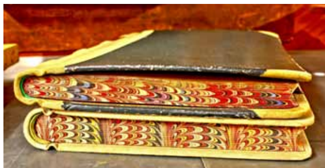
Buchbinder sind Experten, die aus Einzelblättern Bücher binden.

Druckereimuseum Sandkrug Astruper Straße 42 ; 26209 Sandkrug Tel.: 04481-6903 Öffnungszeiten: 14:00 bis 18:00 Uhr (So) Gruppen ab 10 Pers. täglich Eintrittspreise: Normal: 5,00 Euro Ermäßigt: 3,50 Euro