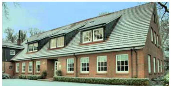
Das Druckereimuseum in Sandkrug: Auf 500 Quadratmetern wird das Thema ›Drucktechnik‹ anschaulich und unter Einbeziehung laufender Maschinen nähergebracht.