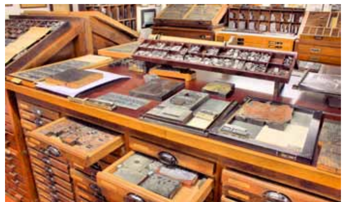
Von aufgelösten Druckereien aus der Umgebung stammen die Originalmöbel mit dem kompletten Inhalt, wie er früher zur Buchproduktion verwendet wurde.