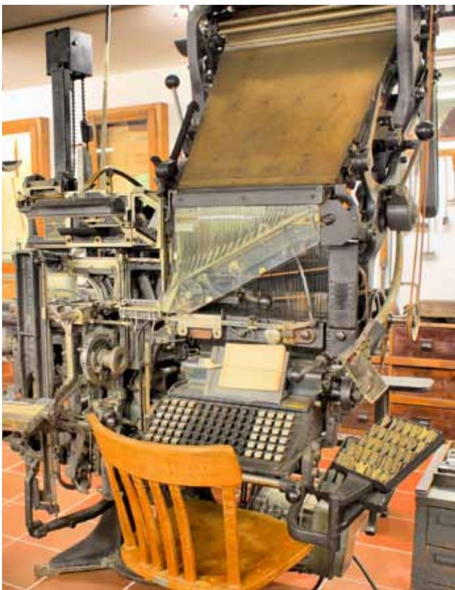
Betriebsbereite Linotype-Maschinen zeigen allgemein verständlich, wie vor noch nicht allzulanger Zeit Schriftsetzer die Lettern für den Buchdruck erstellten.

Im Druckereimuseum Sandkrug kann man die Lettern, die die Welt veränderten, selbst in die Hand nehmen und ihre Genialität auf sich wirken lassen. Das Museum besitzt im Untergeschoss eine unglaubliche Zahl davon. Inmitten der Originaleinrichtung einer Druckerei fühlt man sich rasch wie ein echter Buchdrucker. Hautnah bekommt man vermittelt, dass dieser Beruf einiges abver-