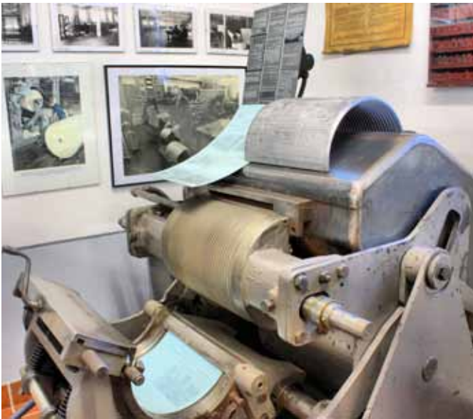
Die Herstellung von gegossenen Druckplatten wird in Sandkrug an Originalmaschinen sehr anschaulich demonstriert. Hier lohnen sogar mehrere Blicke auf das interessante Verfahren.

Steuerzeichen begleitet wurde, die dem Filmbelichter sagten, wie der Text auszusehen hat. Ganzseitendarstellung in ›Wysiwyg‹ (What You see is what You get) war damals noch ein Fremdwort. Das änderte sich mit dem ›Typeview 300‹. Dies war ein Monitor, der vorab sichtbar machte, was der Setzer in die CRTronic 340 eingegeben hatte.