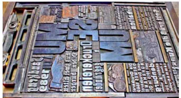
Der Schriftsetzer musste perfektes Deutsch beherrschen und den Text auch noch spiegelverkehrt lesen können, damit eine fehlerfreie Zeitungs- oder Buchseite entstand.