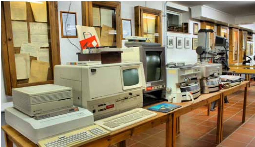
Im Museum gibt es eine »CRTronic 340« von Linotype zu sehen, die den Textsatz per Textverarbeitungsprogramm ermöglichte. Wysiwyg war damals noch ein Fremdwort. Das änderte sich erst mit »Typeview 300«, einem Monitor, der sichtbar machte, was in die CRTronic 340 eingegeben wurde.

ne Bücher vom Buchbinder gebunden werden. Dabei ist große Konzentration bereits beim Zusammentragen der einzelnen Blätter nötig. Wer hier nicht aufpasst, bindet Seiten in der falschen Reihenfolge oder sogar auf dem Kopf stehend zusammen.