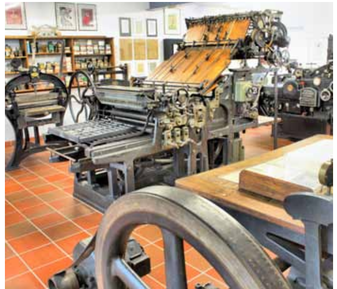
Ob Farbe, Presse oder Druckmaschine aus der Anfangszeit des Buchdrucks es gibt fast nichts, was es in Sandkrug nicht zu sehen gibt.

In Sandkrug erfährt man zudem, wie vor dem Computerzeitalter die Druckplatten hergestellt wurden. Sicher ist bekannt, dass Druckplatten gegossen wurden. Doch auf welchem Weg kommt man zu diesen Druckplatten? Im Museum wird auch dies erläutert: Es wird zunächst ein spezieller, hitzefester Karton