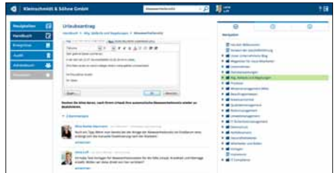
Kommentarfunktionen bei Orgavision verhindern, dass Verbesserungsvorschläge ignoriert oder vergessen werden.

Denn Woithons Software hält Dokumente nicht nur auf dem neuesten Stand, sondern dokumentiert genauso jede geänderte Zeile mitsamt ihrem Zeitpunkt. Das sei besonders interessant für die Firmen, die eine Informationspflicht gegenüber ihren Mitarbeitern haben. Bei Sicherheitsfragen an Maschinen etwa oder dem Handling gesundheitsgefährdender Stoffe. »Der Verantwortliche kann