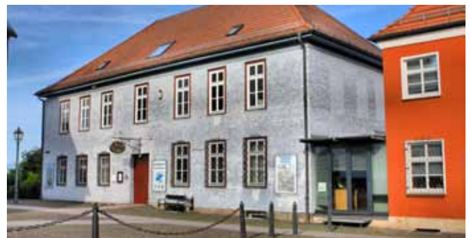
Das Konrad-Zuse-Museum beherbergt viele Exponate aus der Stadtgeschichte von Hünfeld. Highlight ist eine Sammlung von Zuse-Rechnern, die der Erfinder des Computers selbst ersann.