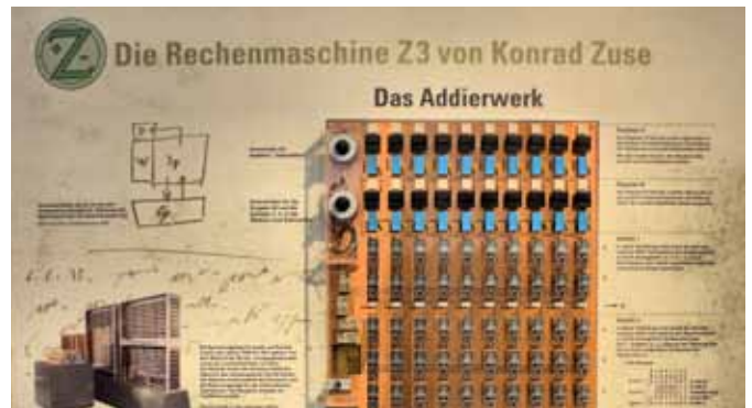
Der Z3 war der erste funktionsfähige Computer der Welt. Im Museum ist er als Funktionsnachbau in Relais-technik wiederaufgebaut. Im Bild ist dessen Addierwerk zu sehen.