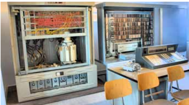
Unter der Bezeichnung »Z31« bot Zuse einen Dezimalrechner in Transistortechnik an. Die Anlage konnte durch Zusatzgeräte dem Bedarf angepasst werden.

Die Z31 von 1961 war eine vertane Chance. Der in Transis-