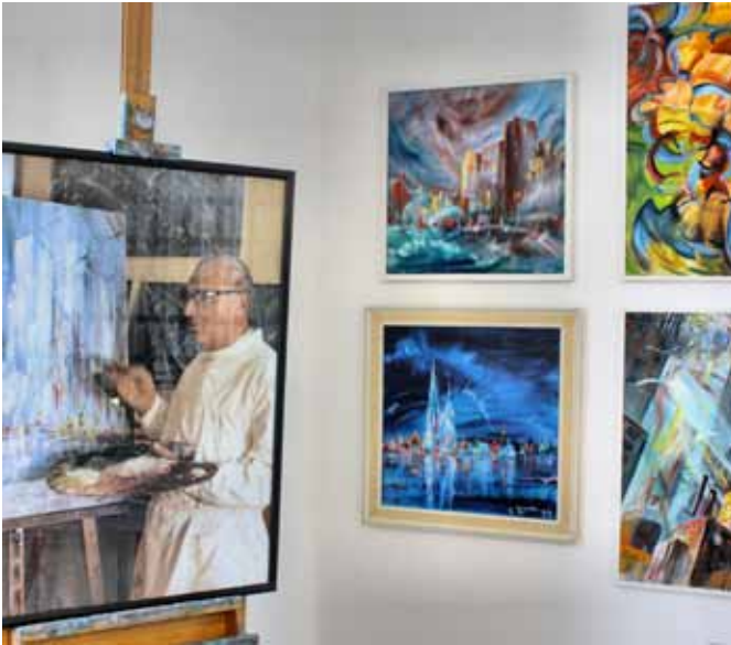
Konrad Zuse war nicht nur ein überragender Computerpionier, sondern auch ein exzellenter Maler, der in ausdrucksstarken Bildern seine Genialität offenbarte.

gebaute Modell »Z22« wurde mit Röhren bestückt, nachdem die Zuverlässigkeit dieser Bauteile sich besserte. Mit dem Z23 hielt der Transistor in Zuses Rechner Einzug. Diesen gab es mit einem Magnetrommelspeicher sowie einem Ferritkernspeicher. Herausragend war die weitestgehende Kompatibilität zur Z22, wodurch Kunden einfach vom alten Röhrenmodell umsteigen konnten, ohne die Programme neu erstellen zu müssen.