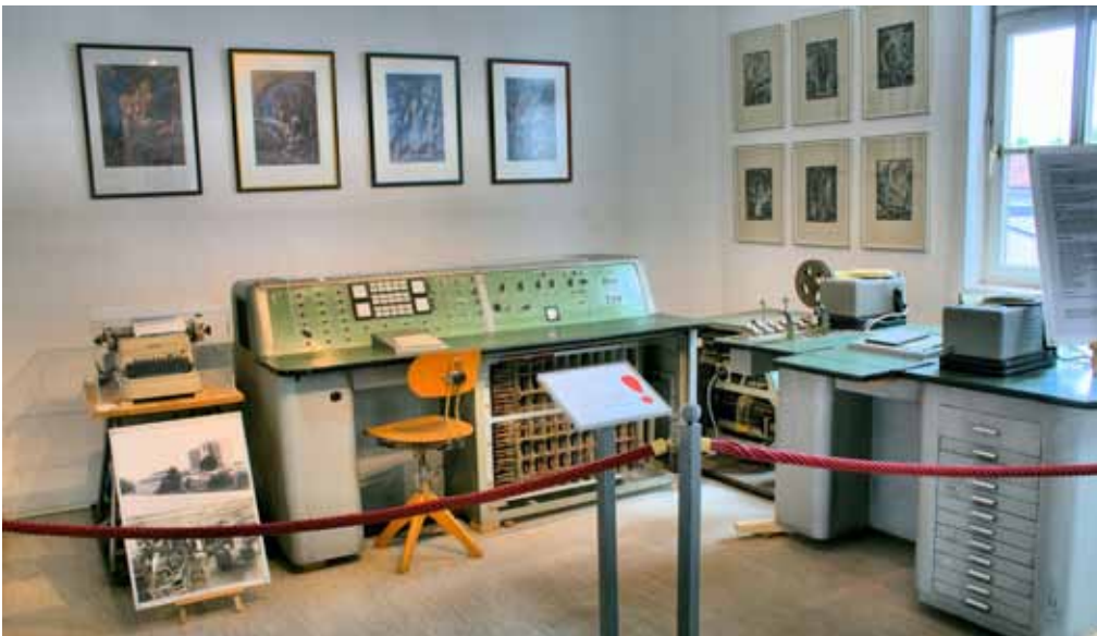
Der Relais-Rechner »Z11« wurde in der Flurbereinigung, in der Stadtvermessung sowie in der optischen Industrie eingesetzt. Er war sehr beliebt, da die Programme per Drucktasten ausgewählt werden konnten.

tortechnik ausgeführte Dezimalrechner wurde nur sieben Mal ausgeliefert und brachte Verluste in Millionenhöhe. Das Unternehmen Zuse hatte es versäumt, sich rechtzeitig der aufkommenden kommerziellen EDV zuzuwenden, wo sich größere Absatzpotenziale ergeben hätten.