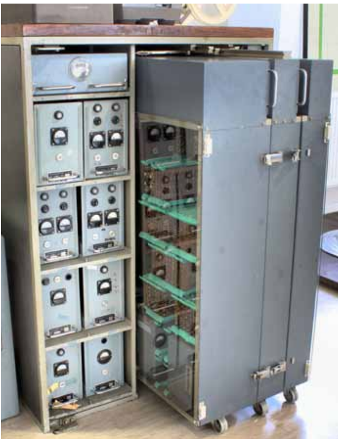
Der im Transistorrechner ›Z25‹ verwendete Transistortyp benötigte eine spezielle Löttechnik, was bei der Entwicklung übersehen wurde. Die Folge waren Liquiditätseingüsse.

Er hat wohl auch als erster die vom polnischen Mathematiker Jan Lukasiewicz entwickelte ›polnische Notation‹ weiterentwickelt und daraus die ›umgekehrte polnische Notation‹ (UPN) ersonnen, da diese in seinen Rechnern verwendet wird: zunächst werden die Werte eingegeben, danach die