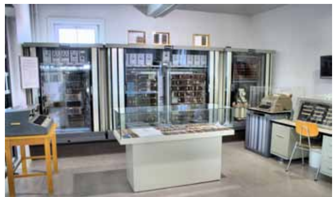
Bildeten zunächst Relais-Schaltungen die Grundlage für die Rechner von Zuse, hielt mit der Z23 der Transistor in Zuses Rechner Einzug.