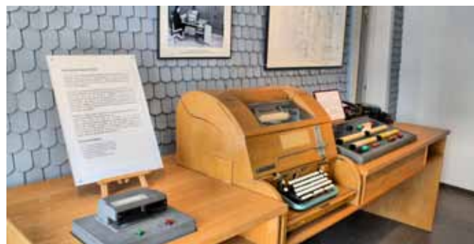
Auch der Röhrenrechner »Z22« ist in Hünfeld zu bestaunen.

Konrad-Zuse-Museum Hünfeld Kirchplatz 4 - 6; 36088 Hünfeld Tel.: 06652-919884